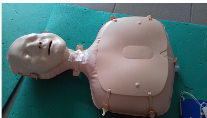
Mannequin d'entraînement Classe de CM1-CM2 Ecole André Labayle

L'infirmière scolaire du collège Toulouse-Lautrec à Langon nous a appris à porter secours à l'école André Labayle le mardi 4 juin 2019.