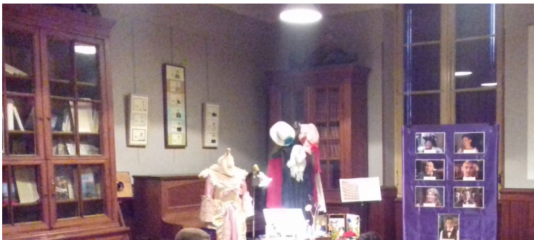
Meurtre à l'opéra

par la classe de Cm1-CM2 - Le 04/07/2019