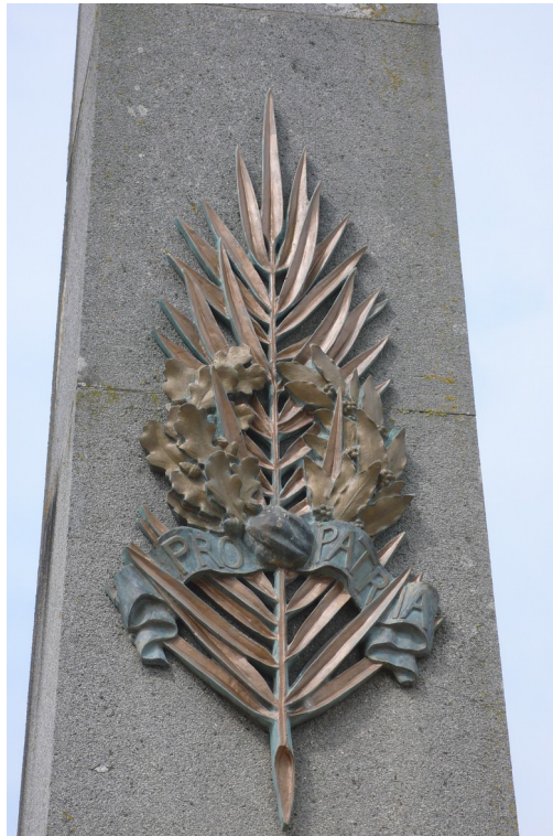
La palme et la couronne. / Classe de CM1-CM2 École André Labayle

Chaque monument aux morts a des symboles. Celui de notre commune en regroupe plusieurs. Voici ce qu'ils représentent.