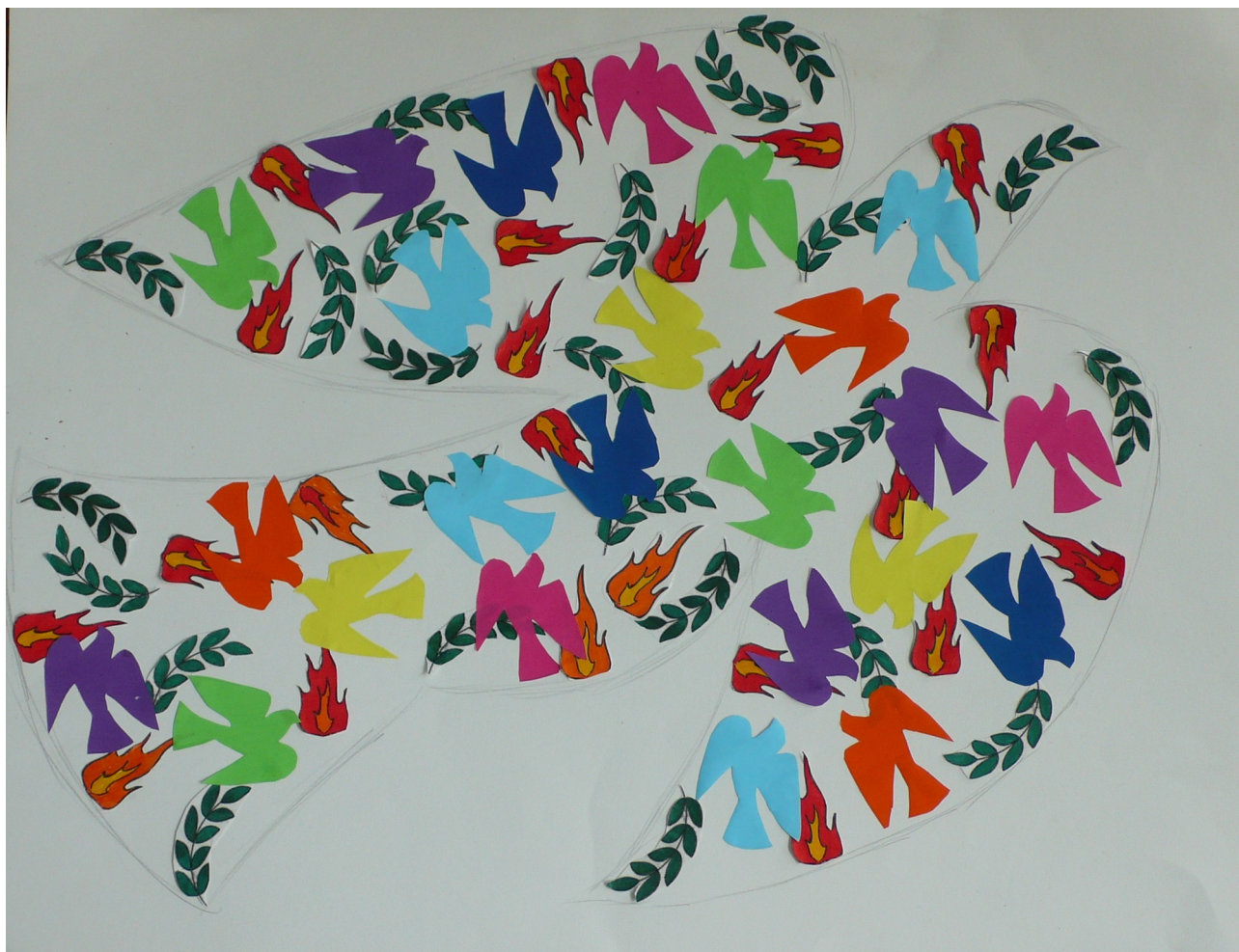
Symbole pour la paix des élèves de CM1-CM2 de l'école André Labayle Classe de CM1-CM2, École André Labayle

Voici le travail de la classe de CM1-CM2 de l'école André Labayle de Saint-Pierre de Mons. Depuis qu'ils ont décidé de participer à l'opération "Enfants pour la paix", les élèves sont devenus des petits journalistes. Ils ont dû apprendre à rédiger un article, faire des recherches, poser des questions, vérifier leurs informations... Ils ont aussi collectivement imaginer, organiser et réaliser un symbole qui, pour eux, représente la paix.