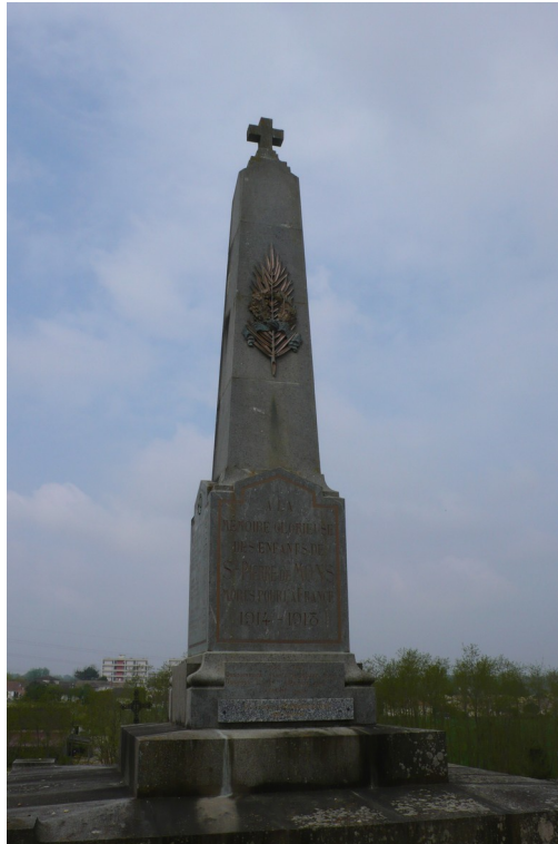
Le monument aux morts. / Classe de CM1-CM2 École André Labayle

Dans notre commune, Saint-Pierre de Mons en Gironde, il y a un monument aux morts et une plaque. Nous sommes allés les voir.